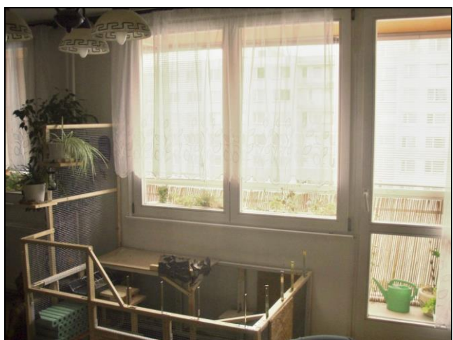
pokoj – vstup na lodžii